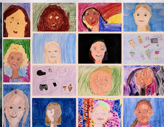
Gruppearbeid. Austevoll kulturskole